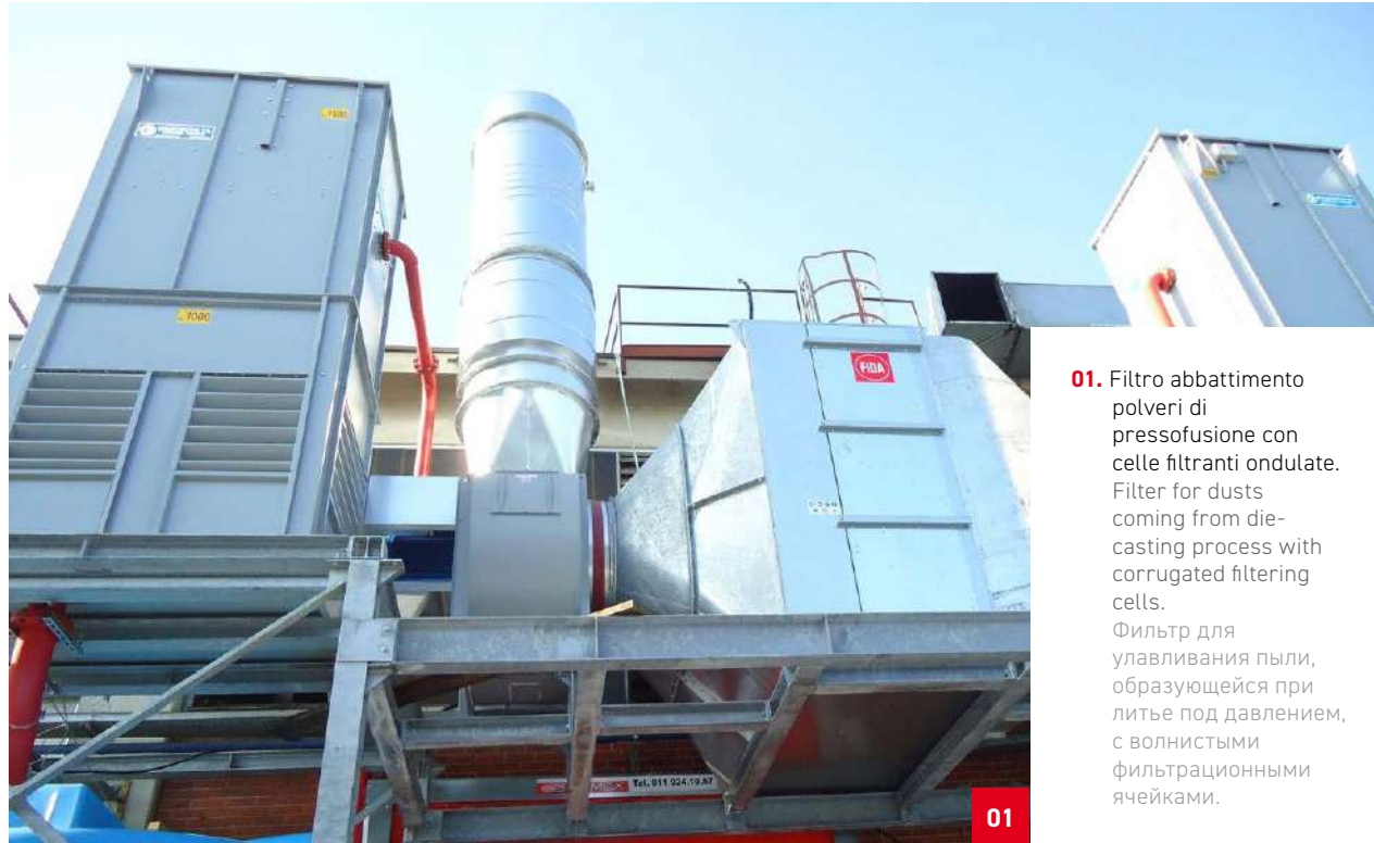
01. Filtro abbattimento polveri di pressofusione con celle filtranti ondulate. Filter for dusts coming from die-casting process with corrugated filtering cells. Фильтр для улавливания пыли, образующейся при литье под давлением, с волнистыми фильтрационными ячейками.

Mechanics and foundry / Машиностроение и литейная промышленность