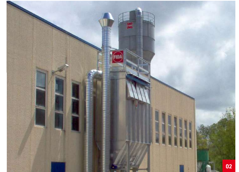
02. Filtro a maniche funzionante in depressione per polveri di levigatura di alluminio. Bags filter working in negative pressure for aluminium sanding dusts. Рукавный фильтр, работающий под разрежением, для пыли, образующейся при шлифовании алюминия.