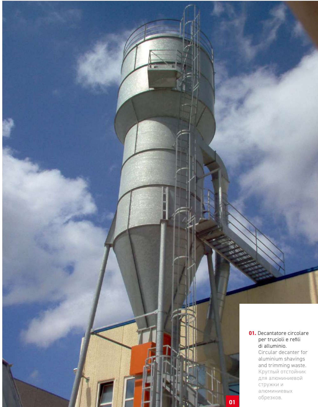
01. Decantatore circolare per trucioli e reflui di alluminio. Circular decanter for aluminium shavings and trimming waste. Круглый отстойник для алюминиевой стружки и алюминиевых обрезков.

Mechanics and foundry / Машиностроение и литейная промышленность