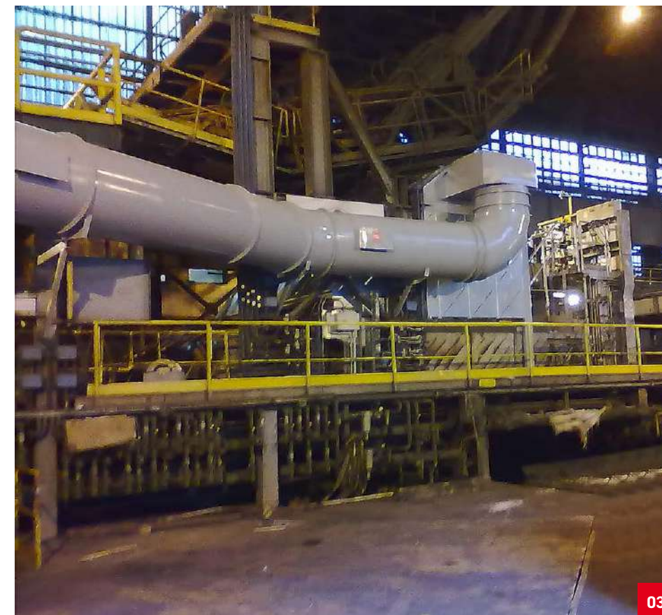
03. Cappa di aspirazione fumi da ossitaglio con relativa canalizzazione. Hood to suck oxy-fuel welding and cutting smokes with relating canalisation. Вытяжка для дымов, образующихся при газовой резке, с соответствующими трубопроводами.