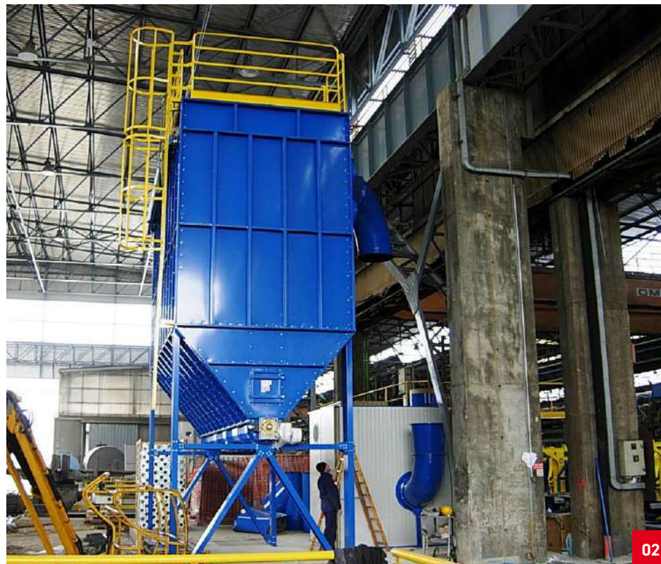
02. Filtro di abbattimento polveri di troncatura metalli. Filter for steel cutting dusts. Фильтр для улавливания пыли, образующейся при обрубке металлов.